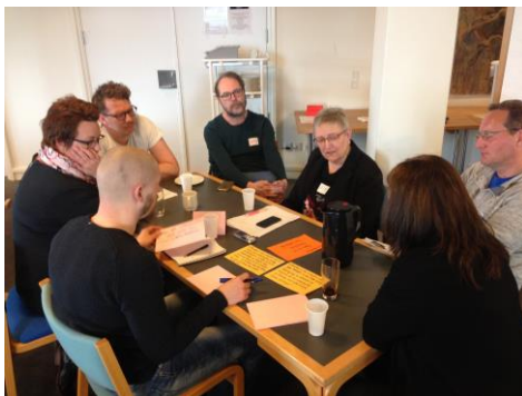
Fra projektsamlingen den 25. april