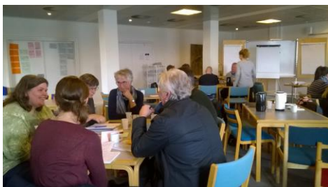
Fra projektsamlingen den 25. april