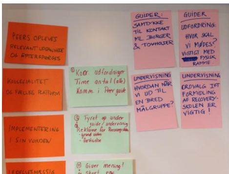
Fra projektsamlingen den 25. april