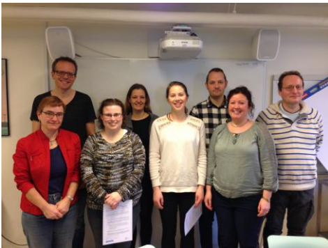
Dimittender fra Aarhus m. undervisere