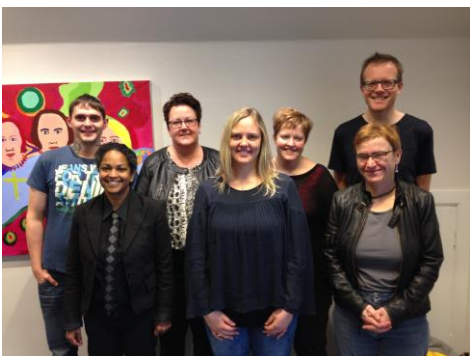
Dimittender fra Viborg m. undervisere