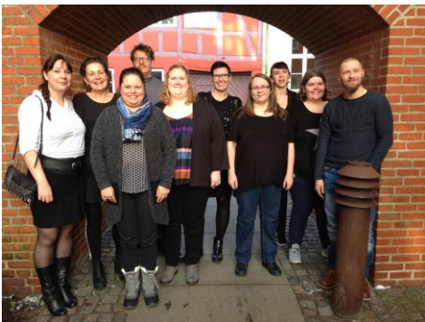
Dimittender fra Randers m. undervisere